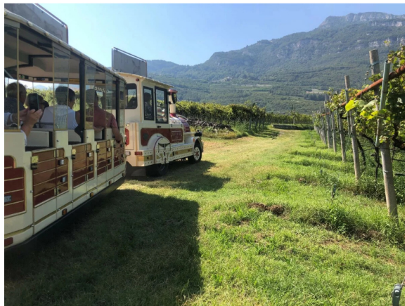
Wine Train