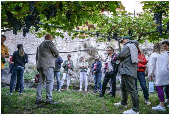
Tra vigneti e palazzi