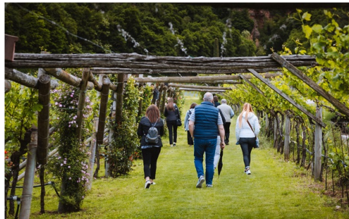
DiVin Ottobre 2024

Unisciti a DiVin Ottobre 2024 per un viaggio tra i sapori autunnali del Trentino, con degustazioni di vini, passeggiate tra i vigneti e celebrazioni del foliage!