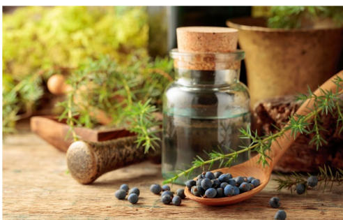
Fototeca FI Roncadro

La rassegna inizia in grande stile venerdì 4 ottobre con "Il bramito del cervo sul Baldo" a Brentonico, dove, oltre alla cena al Ristorante Maso Palù, è prevista una passeggiata notturna nel bosco per ammirare i cervi nel loro habitat naturale. Sabato 5 ottobre sarà la volta di "Marzemino in festa" a Isera, dalle 14,30 alle 23,00, con laboratori per bambini, degustazioni di vino e una visita in treno tra i vigneti.