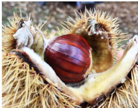
divinottobre fototecastradavinosaiprentino ph i campolongo

In Trentino le occasioni per vivere esperienze ed emozioni in un contesto naturalistico unico non mancano mai. E così, quando l'estate si esaurisce lasciando spazio al clima più fresco, ai colori caldi che tingono magicamente i boschi, ai prodotti e ai profumi tipici dell'autunno, è già tempo di vivere gli appuntamenti di "DIVin Ottobre".