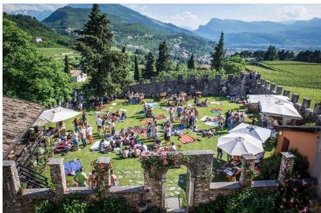
Gemme di Gusto in Trentino