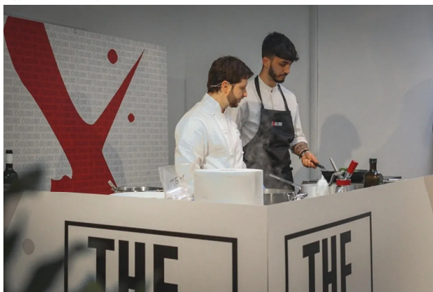
abbinamenti vino-cucina a Vino X Roma

L'appuntamento rientra in un piano di informazione triennale destinato al mondo agricolo locale che ha permesso al GAL di realizzare oltre 40 iniziative tra fiere internazionali, visite studio in altre regioni, workshop o convegni per aggiornare le imprese agricole sulle novità del settore.