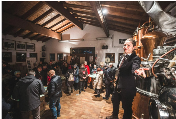
Foto: La notte degli alambicchi accesi.