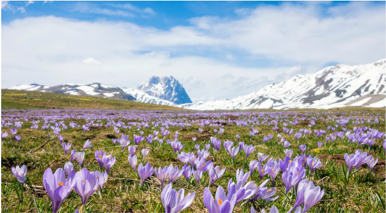
Campi di croco fiorito in Abruzzo. ROMAOSLO