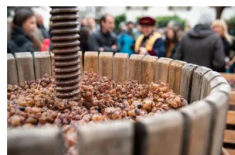
Rito della Spremitura

La Nosiola è l'unico vitigno a bacca bianca del Trentino. Nello stesso periodo si festeggia il Vino Santo, straordinario passito di lunghissimo appassimento e invecchiamento.