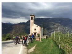
TasteBike Fototeca StradaVinosaporiTrentino Ph. M. Facci

Un appuntamento organizzato dal Consorzio turistico Valle dei Laghi e dall'associazione Vignaioli Vino Santo Trentino Doc, con il supporto di Trentino Marketing, il coordinamento della Strada del Vino e dei Sapori del Trentino – nell'ambito della promozione delle manifestazioni enologiche provinciali denominate #trentinowinefest – e la collaborazione di APT Garda Dolomiti, Consorzio Vini del Trentino, Ecomuseo della Valle dei Laghi, Palazzo Roccabruna di Trento e Casa Caveau Vino Santo.