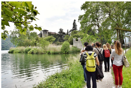
Sul Sentiero della Nosiola.

Un appuntamento organizzato dal Consorzio Turistico Valle dei Laghi e dall'associazione Vignaioli Vino Santo Trentino Doc , con il supporto di Trentino Marketing, il coordinamento della Strada del Vino e dei Sapori del Trentino - nell'ambito della promozione delle manifestazioni enologiche provinciali denominate #trentinowinefest - e la collaborazione di APT Garda Dolomiti, Consorzio Vini del Trentino, Ecomuseo della Valle dei Laghi, Palazzo Roccabruna di Trento e Casa Caveau Vino Santo.