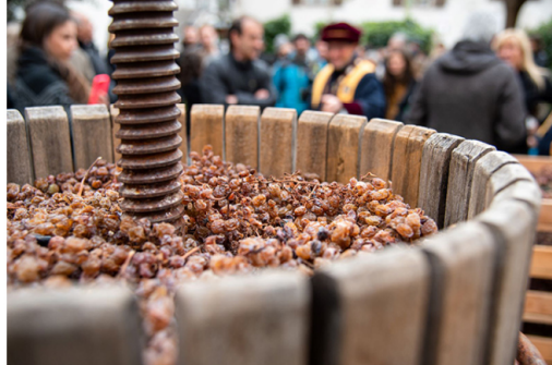
Rito della Spremitura

Per rendere il giusto omaggio ai suoi due gioielli vitivinicoli, "DiVinNosiola: quando il vino si fa santo" propone anche quest'anno un ricco calendario di eventi e iniziative.