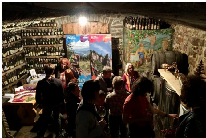
L'iniziativa dei Cembrani Doc torna il 19 ottobre