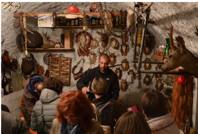
Degustazione in caneve

Dopo il successo delle precedenti edizioni, sabato 19 ottobre torna Caneve En Festa. La manifestazione, organizzata dai Cembrani Doc e inserita all'interno della rassegna "DiVin Ottobre" della Strada del Vino e dei Sapori del Trentino, prevede una cena a tappe nei più affascinanti avvolti del borgo di Cembra.