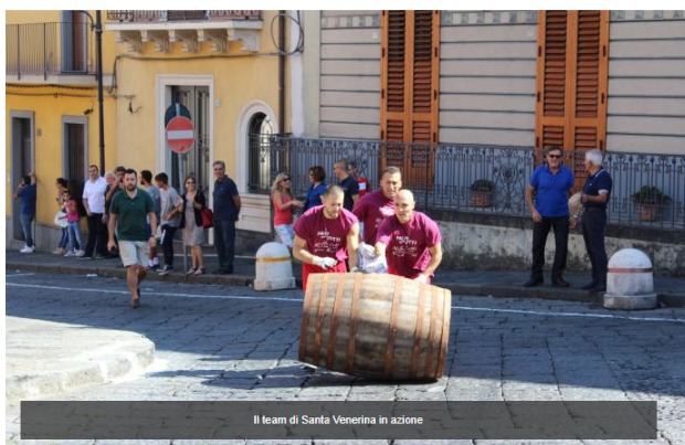
Il team di Santa Venerina in azione

Domenica 8 settembre in Trentino si sfideranno 10 squadre delle Città del Vino